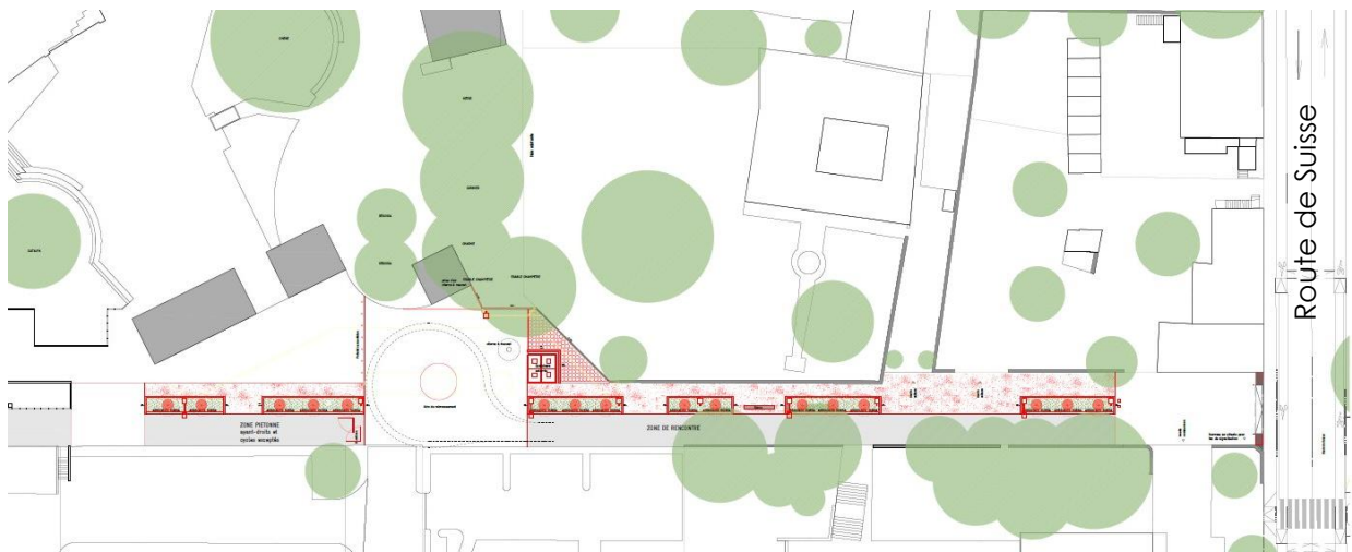
Extrait du plan projet bureau MSV. Novembre 2021 (voir annexe, autre format)