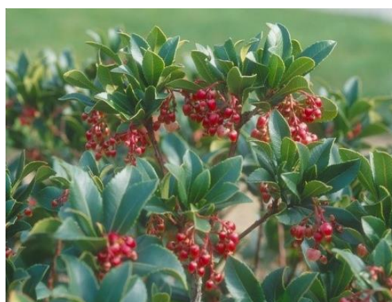
Photos d'arbousier rubra