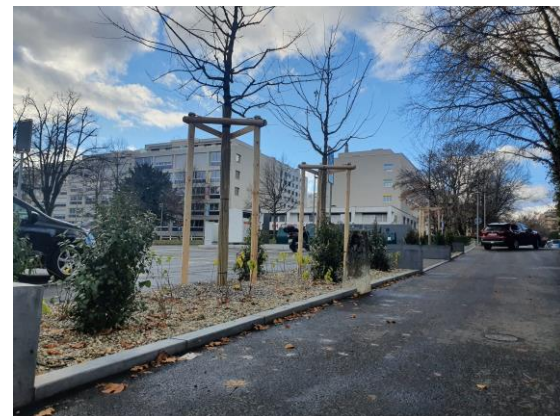
Photos des aménagements réalisés au chemin du Vieux-Port, Place Bordier